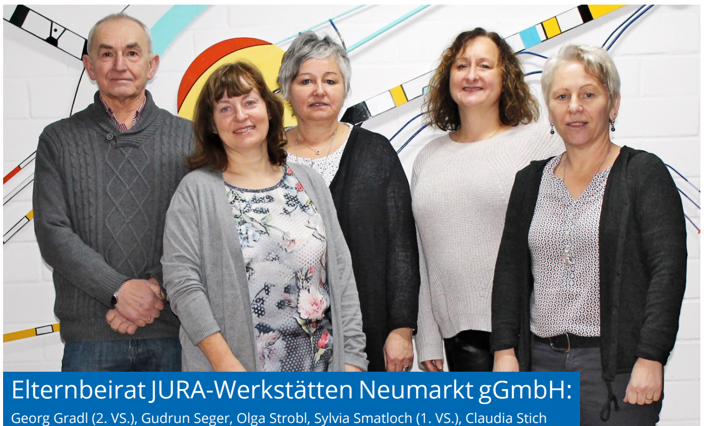
Elternbeirat JURA-Werkstätten Neumarkt gGmbH: