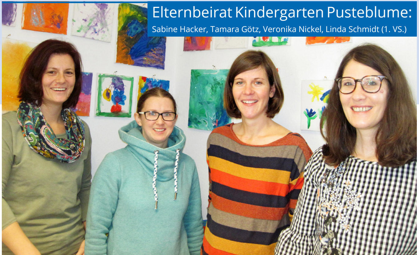
Elternbeirat Kindergarten Pustebume: